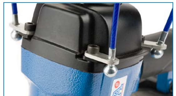
Detail lankového závěsu